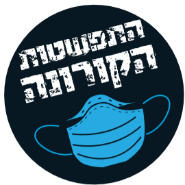
הסופר הרצל פרנקל מגן יבנה וענת מנדל מאשקלון מיישמים בוק סרפינג בעידן הטרור קורונה. ועכשיו - זום

מועדון הקריאה "בוק סרפינג אשקלון" מתעדכן ברוח ימי הקורונה ועובר למפגשים דיגיטליים ב"זום" • החוקים: בוחרים נושא וכל אחד מהמשתתפים מביא טקסט רלוונטי - ספר, שיר, פוסט מפיסבוק או פרסומת מהעיתון, העיקר שיעורר דיון • קריאת כיוון